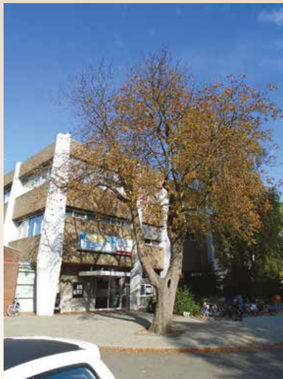
Kastanje bij Gezondheidscentrum

de voet- en fietspaden eveneens ruimschoots aanplant van heesters en struiken. Deze groeiden gestaag. Zo gestaag dat er, vooral door ouderen geklaagd werd over te veel 'enge plekken' gepaard met moeizaam begaanbare tegelpaden. De BOO organiseerde daarom in oktober 1990 de Manifestatie Buitengewoon-Veilig-Ommoord. 1) Deelnemers waren onder meer wethouder mevrouw A.