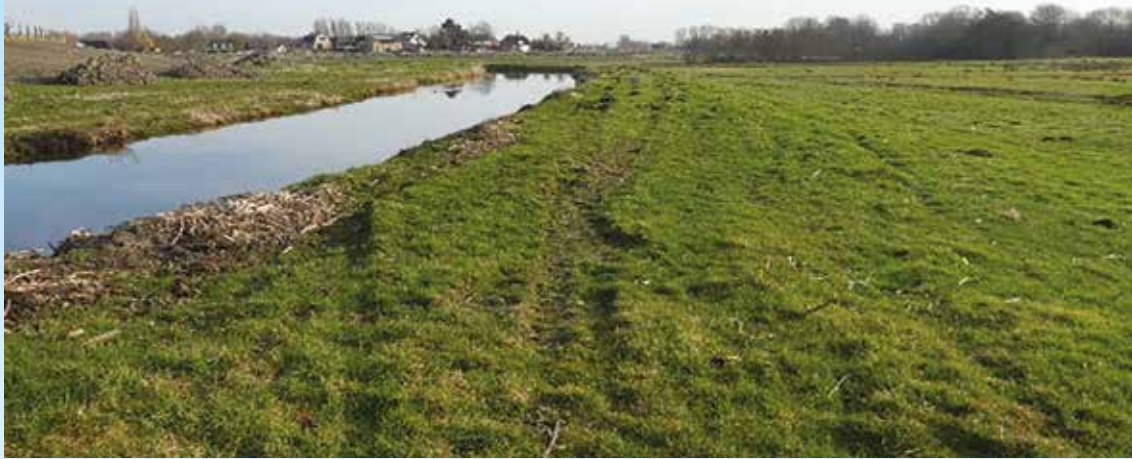
locatie voor het pad langs de tussenboezem

26 De werkgroep Ommoordse Veld Open & Groen is een groep vrijwilligers die ernaar streeft het Ommoordse Veld als natuurgebied te behouden en waar mogelijk de natuurwaarde te verhogen. Wij participeren graag in het overleg over zaken die in het Ommoordse Veld spelen. In dat kader hebben wij onlangs een overleg gehad met Stadsbeheer, de gemeentelijke dienst die verantwoordelijk is voor het onderhoud in het grootste deel van het Ommoordse Veld.